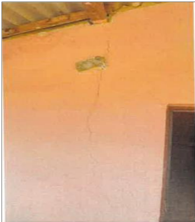
Vista Fotográfica N°04: Se visualiza las vigas y viguetas de madera