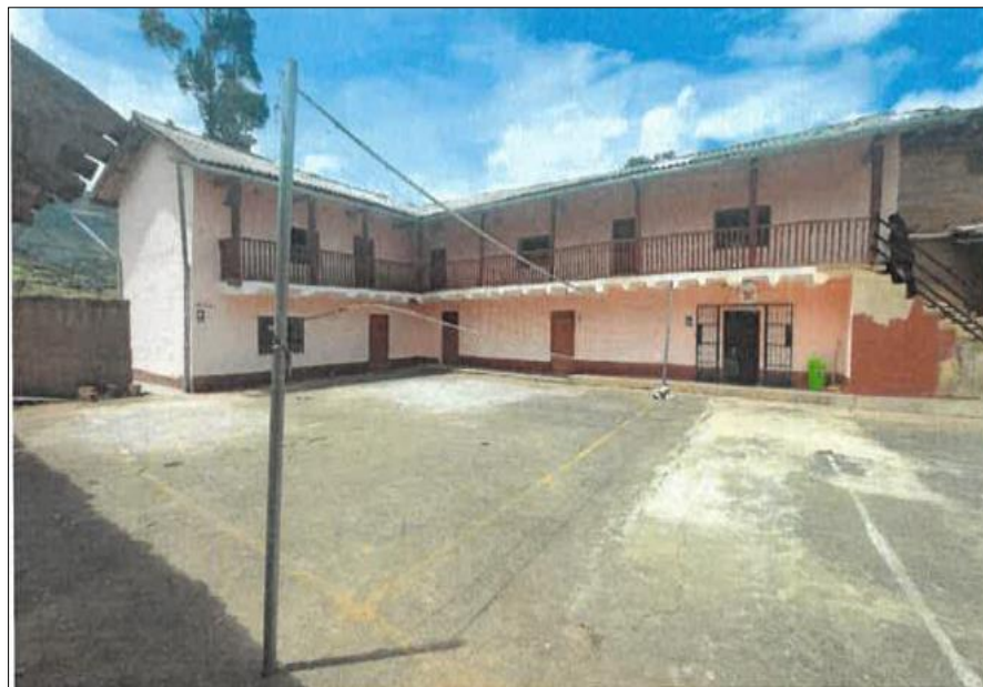
Vista fotográfica N°02: Infraestructura de material rústico, se visualiza fisuras en las paredes interiores