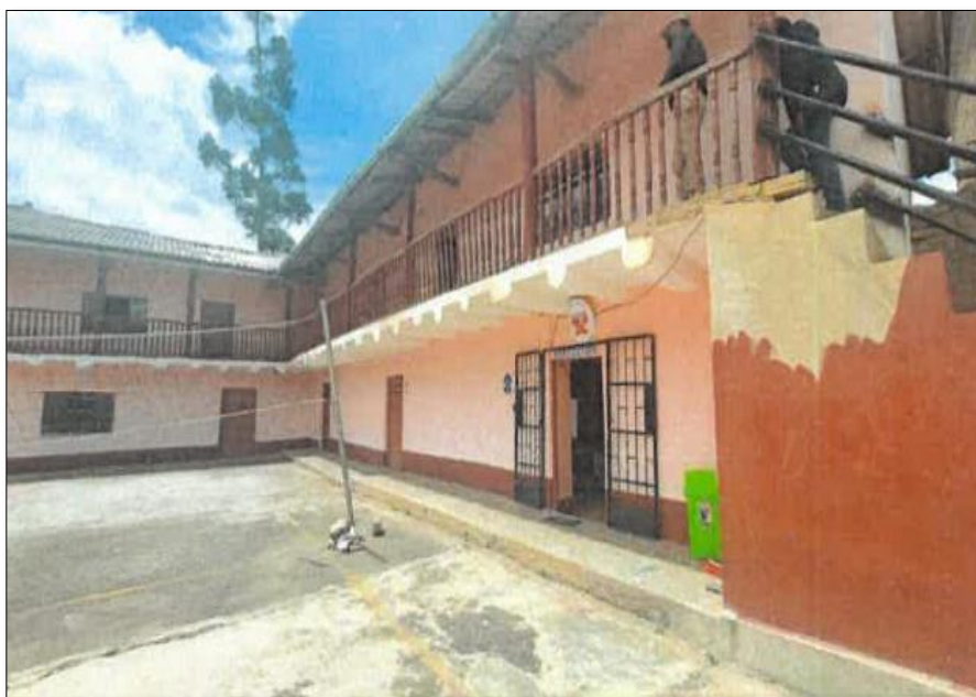
Vista fotográfica N°05: Se visualiza las vigas y viguetas de madera, conjuntamente con la conformación de la cobertura