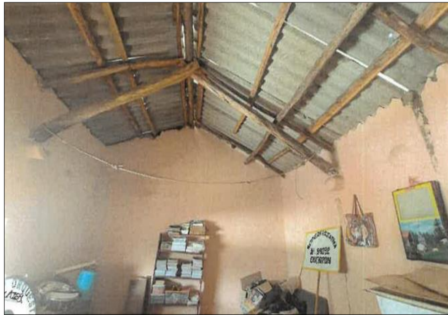
Vista fotográfica N°06: Piso de terrenos natural, se evidencia fisuras