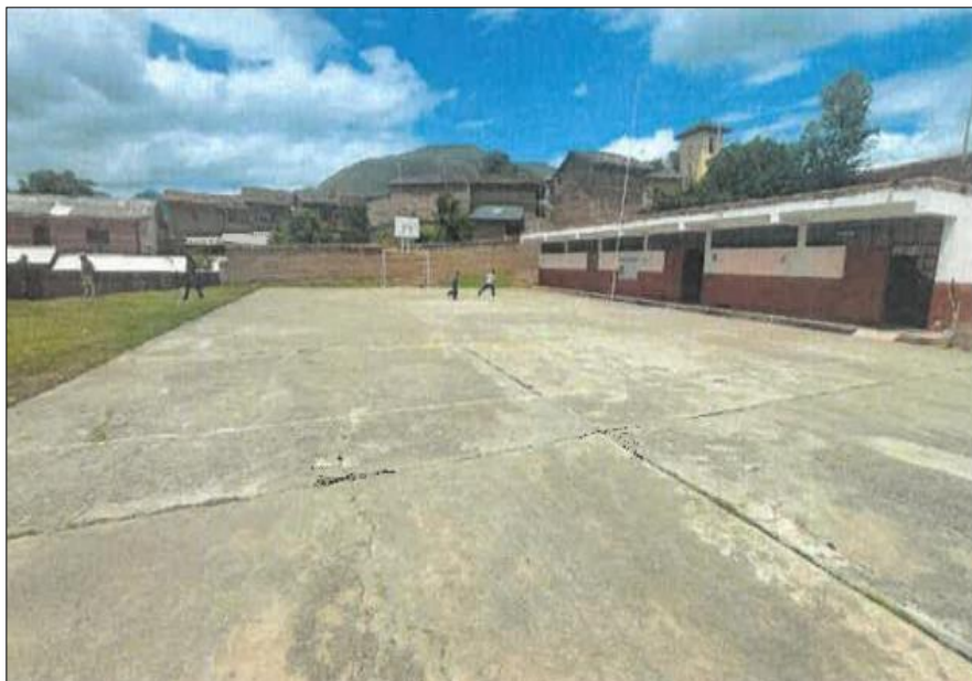
Vista fotográfica N°14: Estado actual de las obras de drenaje en el área educativa, el área administrativa carece del mismo.