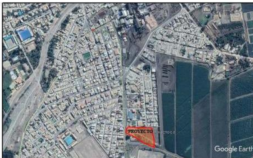
Imagen 01: Esquema de localización del Nuevo Centro de Salud San Jacinto, en Nepeña

El terreno del Nuevo Centro de Salud San Jacinto, es un polígono irregular de 13 lados, con frente hacia el Oeste, donde se tiene la única vía, tanto por el lado norte, este y oeste colinda con propiedades de terceros. Su topografía presenta una pendiente cuya diferencia entre el punto más bajo y el más alto del terreno es de 1.40 ml. Aprox.