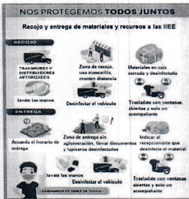
Figura 01: Protocolo de recojo y entrega de materiales

Jr. Los Pinos N° 1166 - Cruce a Santa Bárbara Teléfono 076362812 - 076607525