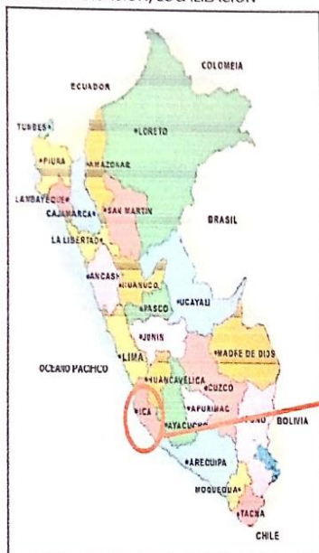
MAPA DE UBICACIÓN, LOCALIZACIÓN

Región : Ica Provincia : Ica Distrito : La Tinguina Lugar : Cercado del Distrito de La Tinguina