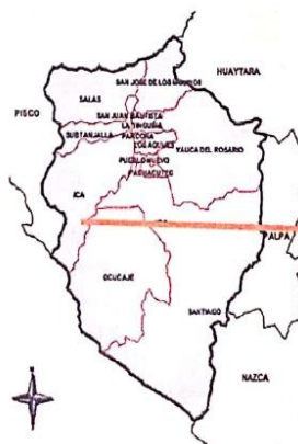
Distritos de Ica.