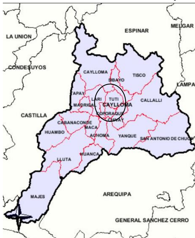
GRAFICO N° 1 AREA DE ESTUDIO-REGION AREQUIPA

El área de estudio es la región Arequipa, provincias de Caylloma, distrito de Tuti.