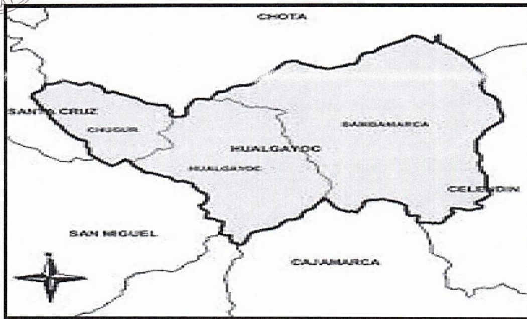
1.3 La provincia de Hualgayoc.