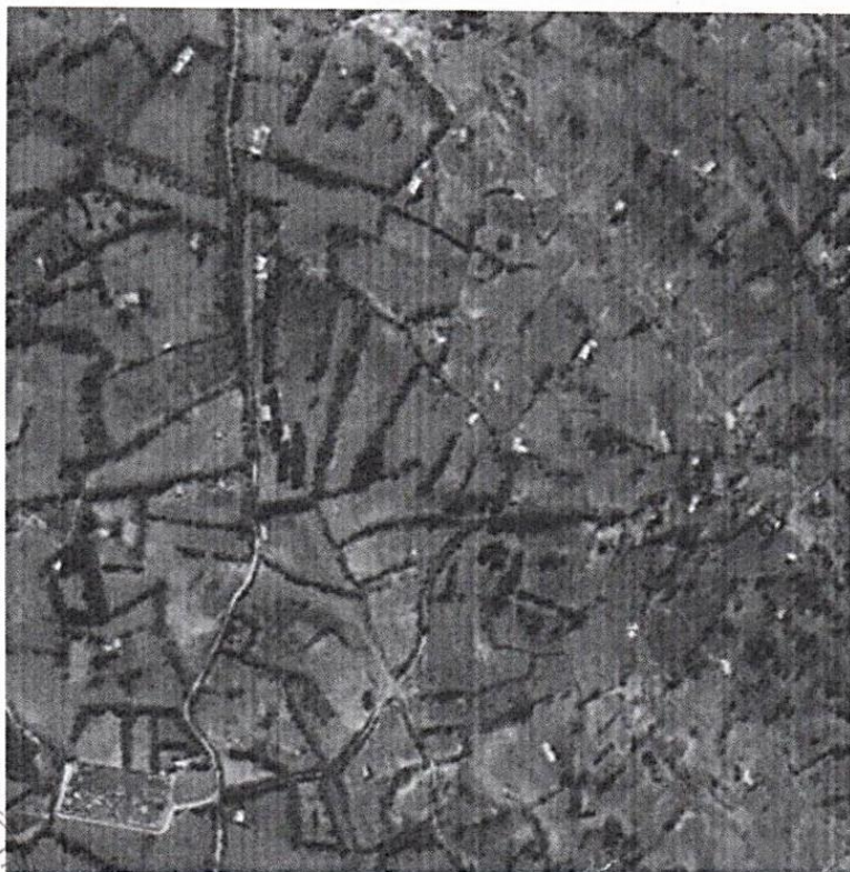
CASERÍO DE MUYA