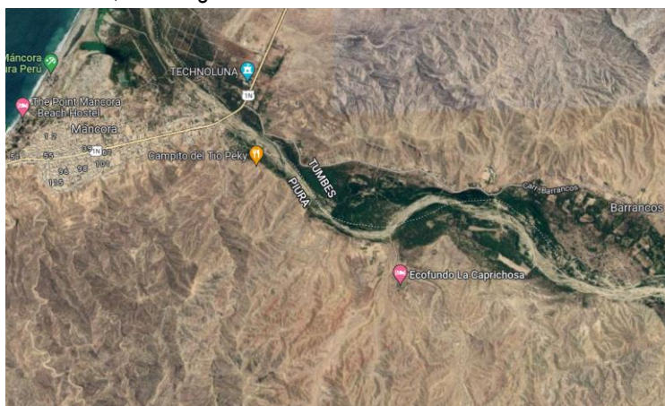
Imagen 01 – Aerofotografía – Ubicación del Puesto de Salud Barrancos

El clima de la zona presenta un clima de tipo semicálido desértico (E(d)B'1H3. Presenta una temperatura promedio de 24.9 °C; y puede variar -en promedio-, desde 19.8°C a 30.5°C. Las temperaturas medias en Tumbes son moderadas con un rango de variación en el ciclo anual de 4°C. La temperatura máxima mensual en promedio es de 34°C y se alcanza entre los meses de febrero y abril. Mientras que, la temperatura mínima mensual en promedio es de 18°C y se alcanza en los meses de agosto y setiembre. La humedad relativa media anual, en la región Tumbes es de 80.86%.