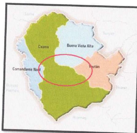
Figura N°03. Ubicación distrital de Casma