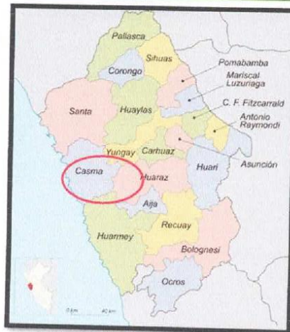
Figura N°02. Ubicación provincial de Casma

MUNICIPALIDAD PROVINCIAL DE CASMA "TIERRA DE LA CULTURA SECHIN Y EL BALNEARIO DE TORTUGAS" REGION ANCASH – PERU GERENCIA DE GESTION URBANA Y RURAL SUB GERENCIA DE OBRAS PUBLICAS PALACIO MUNICIPAL – PLAZA DE ARMAS S/N – TEL (043) 412063