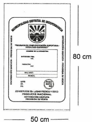
SACO DE MENESTRAS – 20 KG