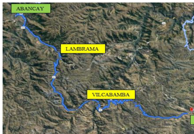
Fig. 2: Tramo para la accesibilidad de Abancay - Challhuahuacho