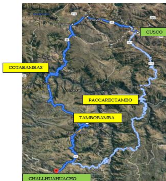
Figura 2: Tramo de accesibilidad de Cusco – Challhuahuacho.