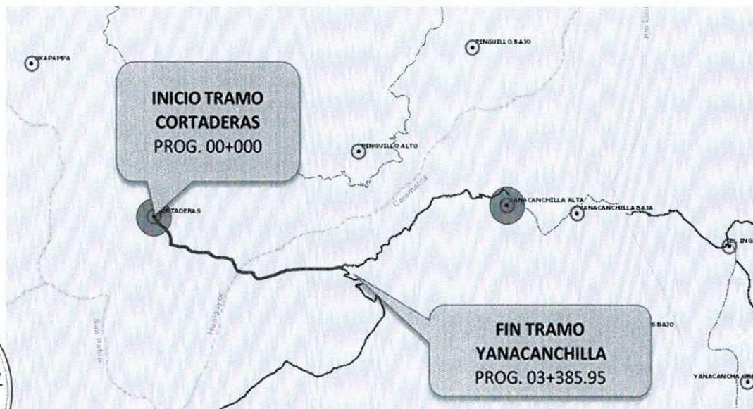
GRÁFICO N° 02: LOCALIZACIÓN DEL PROYECTO