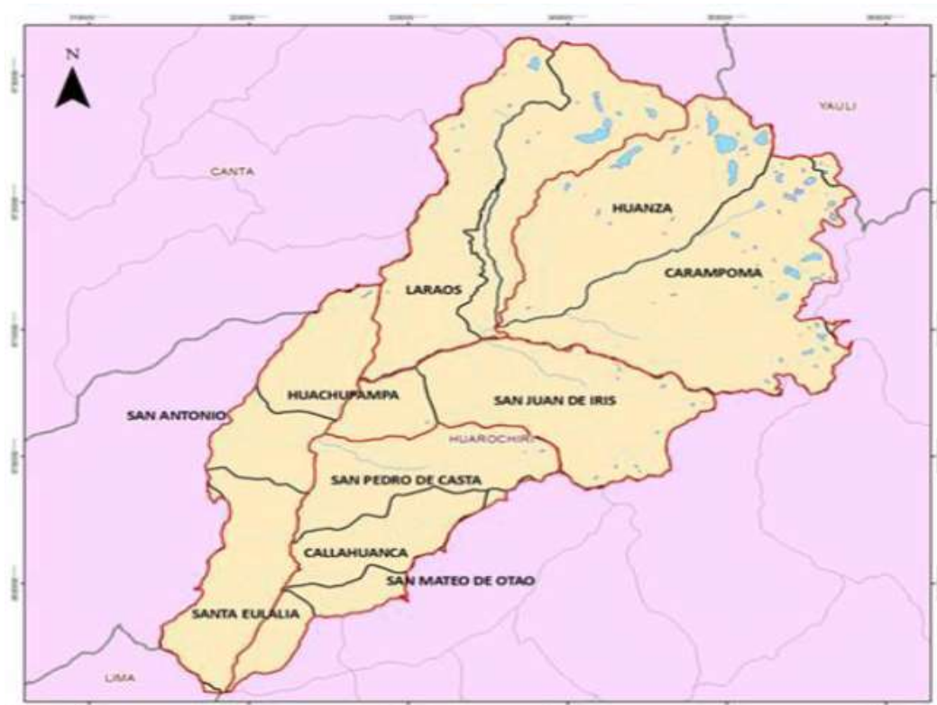
Mapa N° 01: Subcuenca hidrográfica del Santa Eulalia

El distrito de Huachupampa cuenta con una zona bien definida para su acceso, siendo la ruta desde Lima Metropolitana tomando la carretera central hasta el desvío del Distrito de Santa Eulalia, donde la vía se encuentra asfaltada con 46.30. km, con un tiempo de 2h 01min, ingresando al Distrito de Santa Eulalia hasta Lucumaseca donde la vía se encuentra asfaltada con 7.4 km, con un tiempo de 8min, posteriormente se toma una trocha carrozable a la margen izquierda hacia el distrito de Huachupampa, con un recorrido de 44.7 km con un tiempo de 2h 20min.