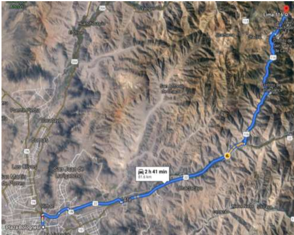
Imagen N° 02: Vía de acceso a la zona de intervención del proyecto desde la Plaza Bolognesi – Lima.