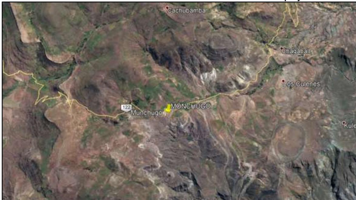
Ilustración 2: Micro- Localización del ámbito de influencia del proyecto.