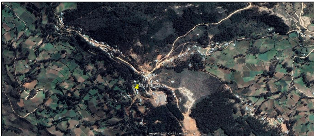
Ilustración 1.- Ubicación del caserío Cusmilán