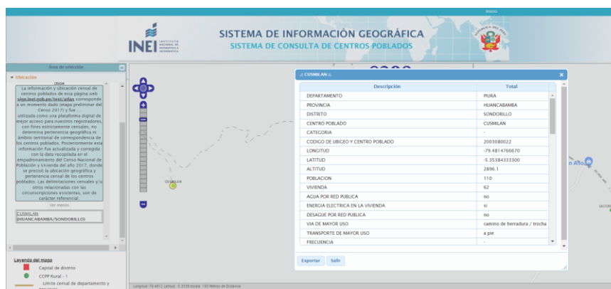
Imagen N° 01: Consulta de Ubigeo de centro poblado en data del INEI

Se deberá colocar el ubigeo de cada centro poblado del proyecto, según se muestra en la data del INEI. Para esto, se podrá acceder al sitio web: http://sige.inei.gob.pe/test/atlas/ .