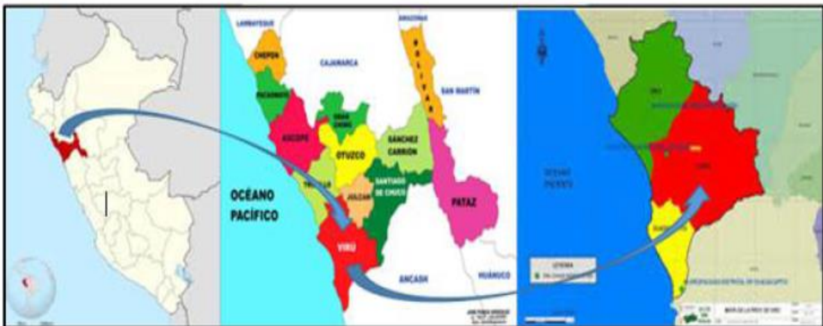
Imagen N°01: Macrolocalización del proyecto

Coordenadas UTM WGS 84: 755896.205E/ 9058695.245N