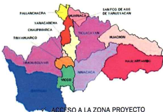
ACCESO A LA ZONA PROYECTO

La vía de acceso tomando como medio de transporte un vehículo ligero y tomando como