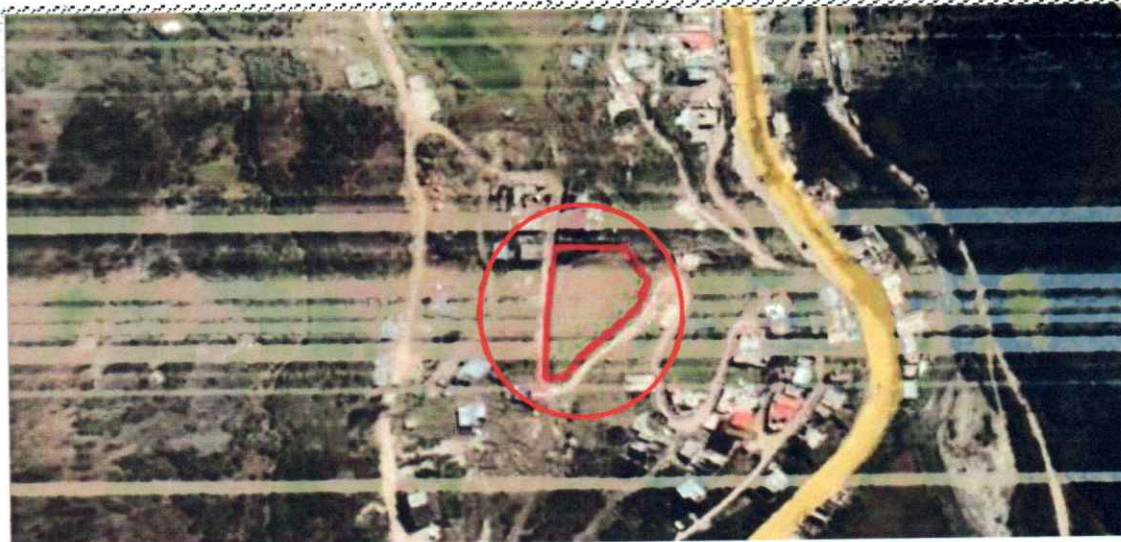
VISTA SATELITAL DEL TERRENO DEL PROYECTO