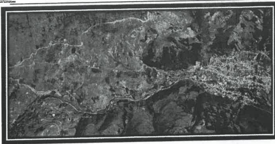
UBICACION DEL PROYECTO INFRAESTRUCTURA TAMBOBAMBA