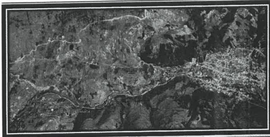
UBICACION DEL PROYECTO REFERENCIA TAMBOBAMBA