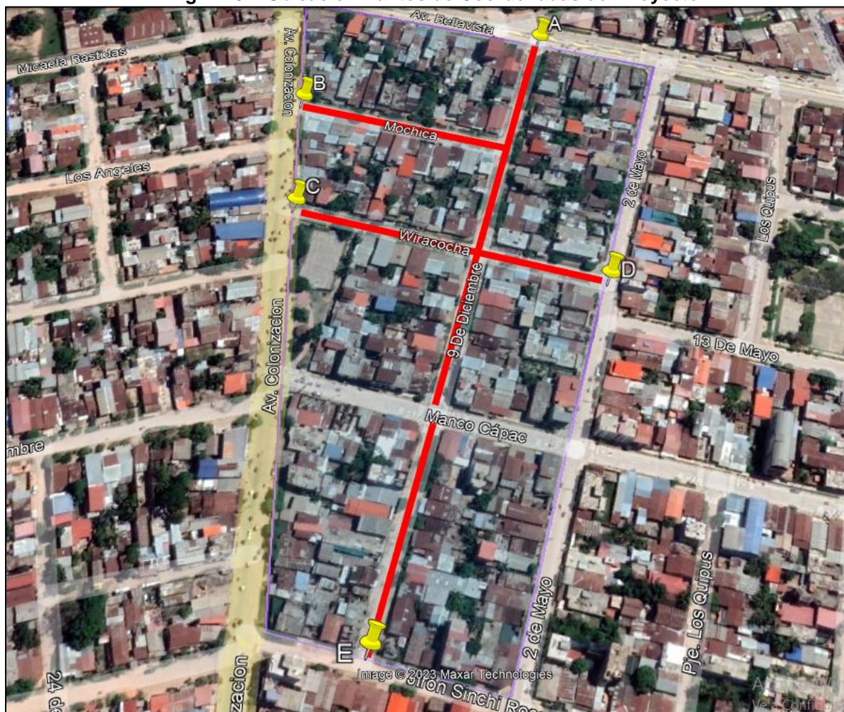
Fig. N° 01: Ubicación Puntos de Coordenadas del Proyecto