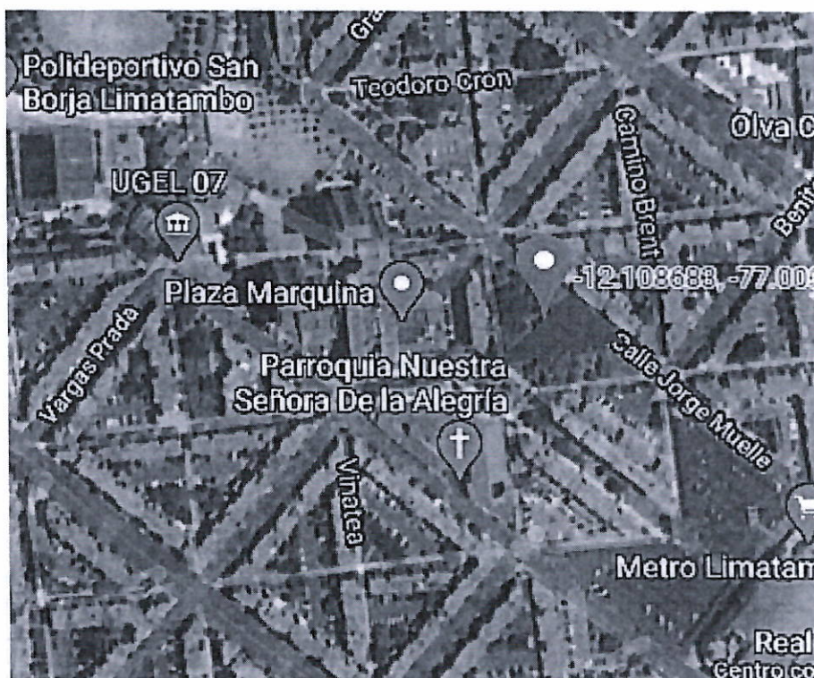
Figura 2: Ubicación de la zona a intervenir