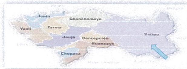
Figura 3. Mapa de ubicación del Distrito de río tambo