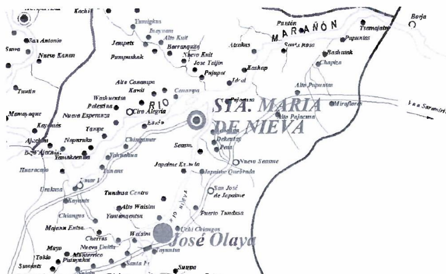
GRAFICO N° 02 LOCALIZACIÓN GEOGRÁFICA DE LA ZONA A INTERVENIR