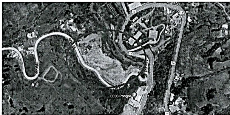
Foto de área del Proyecto

Departamento : Ancash Provincia : Huaraz Distrito : Independencia Sector : Pongor