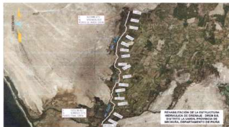
Mapa Satelital del Dren a intervenir