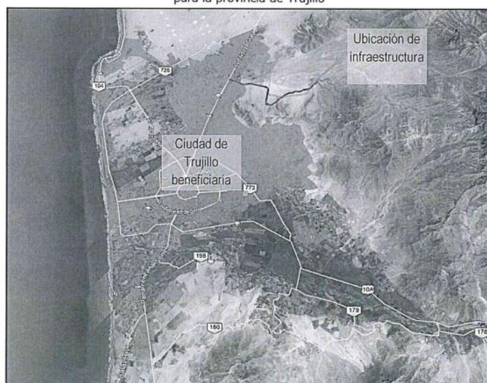
Figura 1. Ubicación de infraestructura de gestión y manejo de residuos sólidos para la provincia de Trujillo