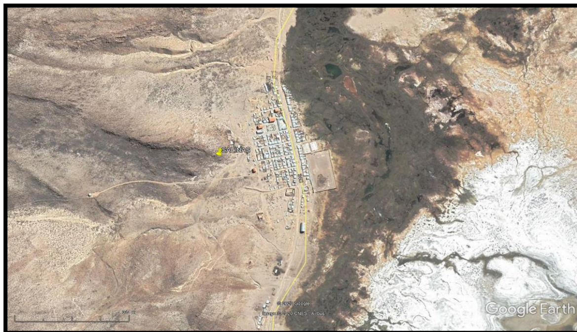
Mapa de Ubicación del Proyecto