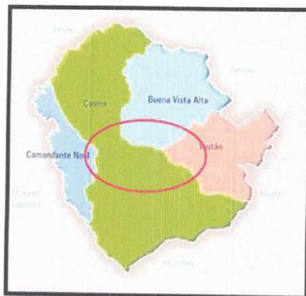
Figura N°03. Ubicación distrital de Casma