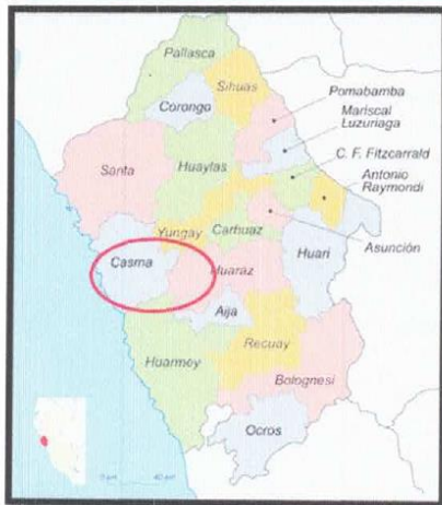
Figura N°02. Ubicación provincial de Casma

MUNICIPALIDAD PROVINCIAL DE CASMA "TIERRA DE LA CULTURA SECHIN Y EL BALNEARIO DE TORTUGAS" REGION ANCASH – PERU GERENCIA DE GESTION URBANA Y RURAL SUB GERENCIA DE OBRAS PUBLICAS PALACIO MUNICIPAL – PLAZA DE ARMAS S/N – TEL (043) 412063