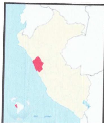
Figura N°01. Ubicación del departamento de Ancash