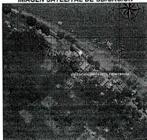
Gráfico N° 01.- MAPA DE UBICACION DEL PROYECTO IMAGEN SATELITAL DE UBICACIÓN

"Año del Bicentenario, de la consolidación de nuestra Independencia, y de la conmemoración de las heroicas batallas de Junín y Ayacucho"