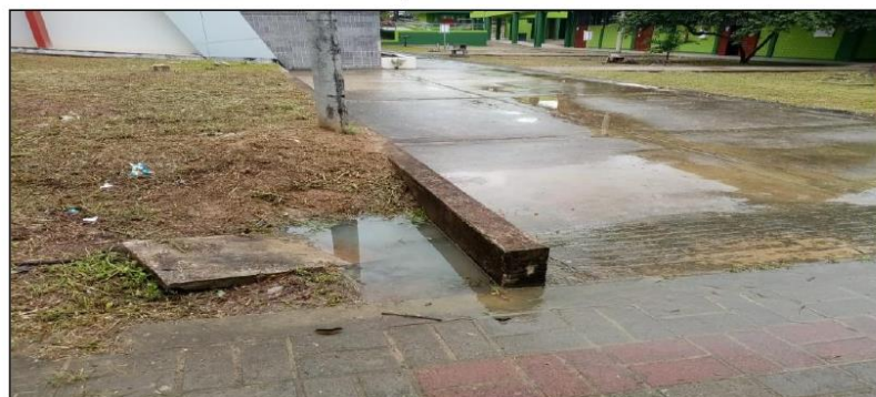
La parte baja es la que presenta mayores problemas en tiempos de lluvia, las aguas no evacuan adecuadamente.