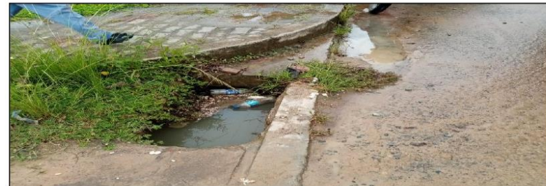
Ausencia de cunetas para evacuar adecuadamente el agua de lluvia