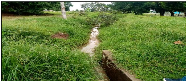
Presencia de encharcamiento en los patios