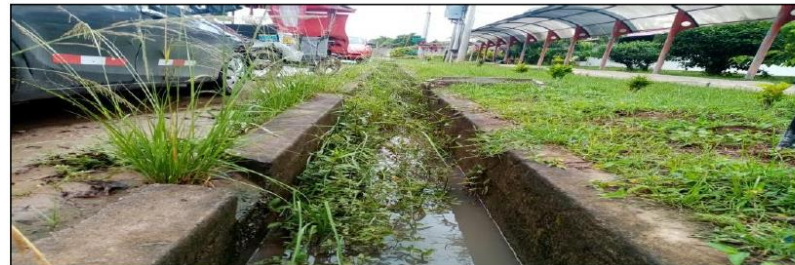
Deficiente diseño de la infraestructura de alcantarillado.

Se evidencia cunetas en pésimo estado de conservación, presencia de aguas retenidas por las escasas actividades de mantenimiento.