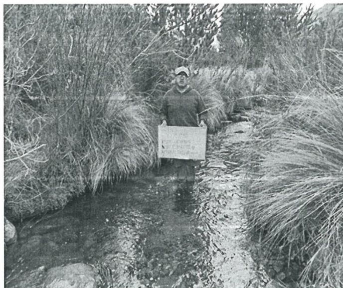
Imagen N° 02: Río Lequecca – fuente hídrica N° 02

"Año del Bicentenario del Perú: 200 años de Independencia"