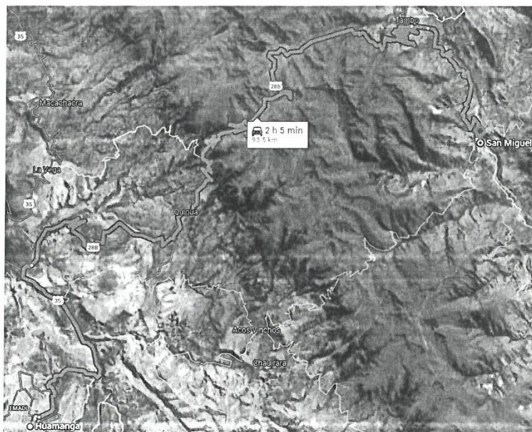
Figura N° 02: Accesibilidad a la Zona del Proyecto