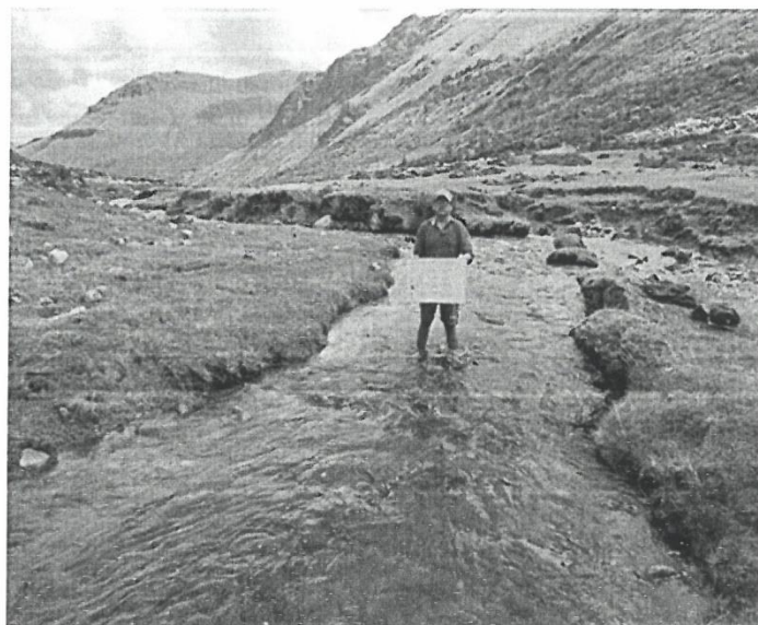
Imagen N° 01: Río Saraccocha – fuente hídrica N° 01