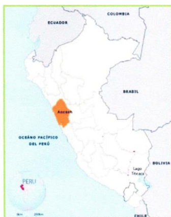
Fig. 1: Mapa Político del Perú