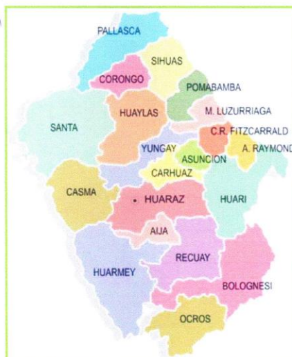
Fig. 2: Mapa de la Región Ancash