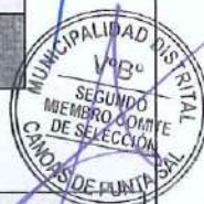
Anexo N° 03