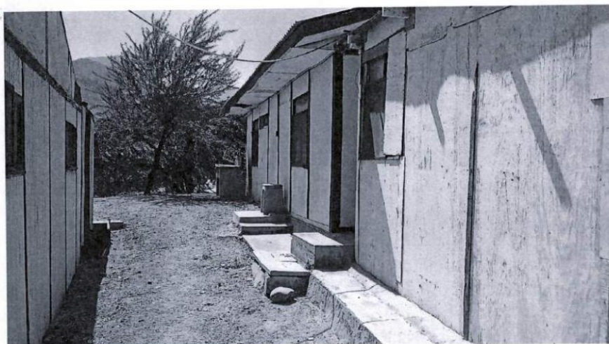
Campamento Tangay S/N