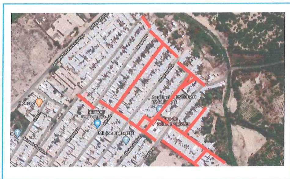
Gráfico 02: Localización del proyecto Elaboración propia