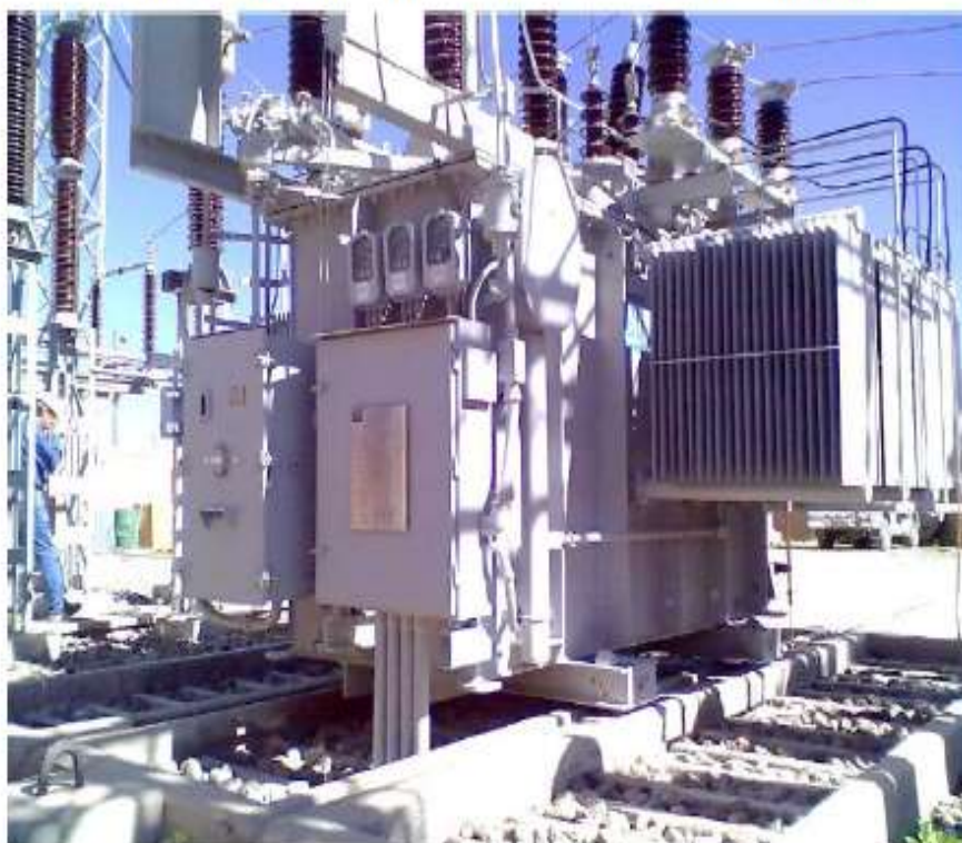
Imágenes de la Válvula de alivio de presión.