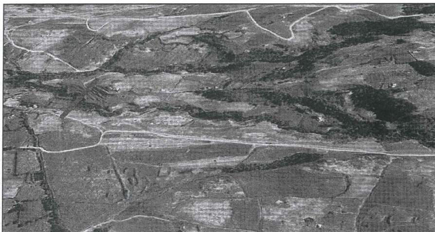
IMAGEN SATELITAL DEL LUGAR DEL PROYECTO