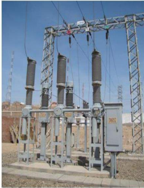
CELDA L-6032 SECHO

Proyecto Especial Olmos Tinajones Unidad de Transmisión Eléctrica 60 KV