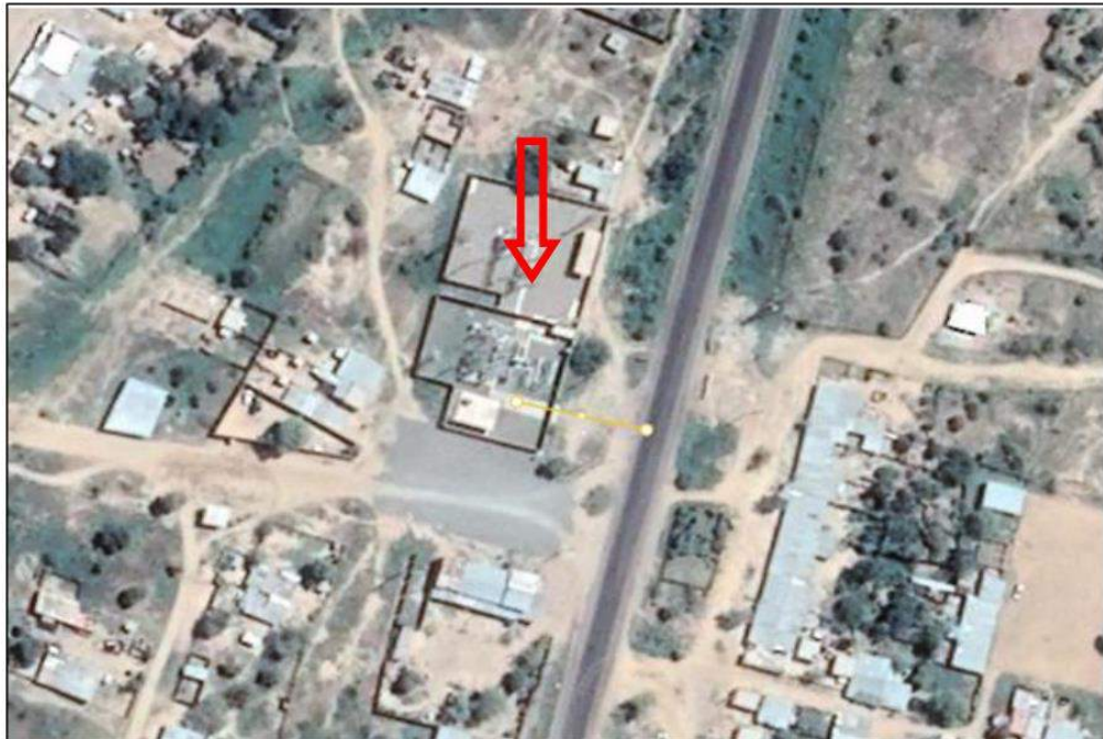
SUBESTACIÓN ELÉCTRICA LA VIÑA

Proyecto Especial Olmos Tinajones Unidad de Transmisión Eléctrica 60 KV