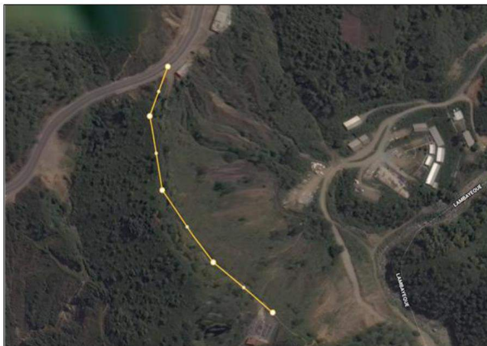
SUBESTACIÓN ELECTRICA OCCIDENTE