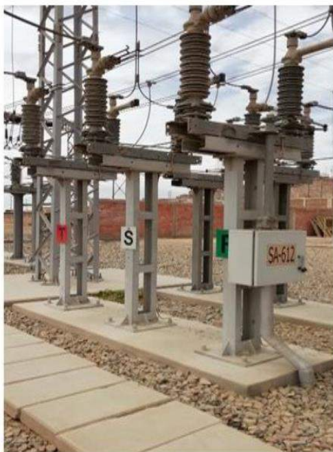
SOPORTE SECCIONADOR DE BARRA