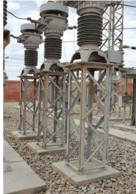
SOPORTE DE TRANSFORMADORES