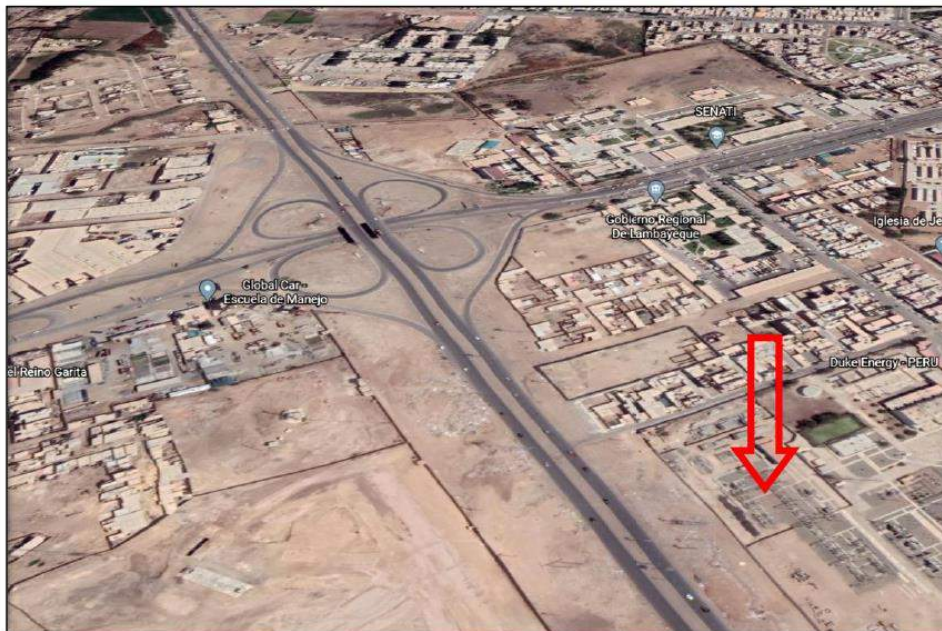
CELDAS DE SALIDA 60 KV SUBESTACIÓN CHICLAYO OESTE

Proyecto Especial Olmos Tinajones Unidad de Transmisión Eléctrica 60 KV