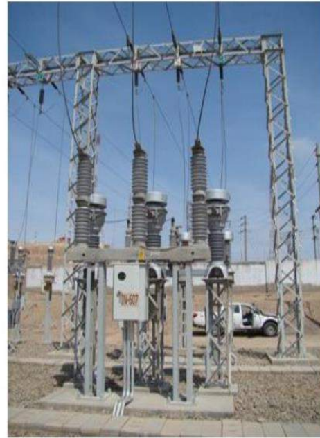
CELDA L-6033 SECHO