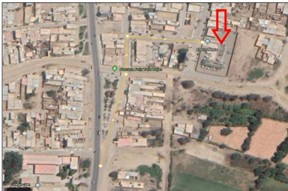
SUBESTACIÓN ELÉCTRICA ILLIMO