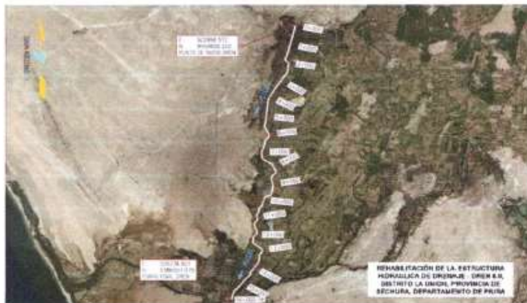
Mapa Satelital del Dren 8.0

COORDENADAS UTM. (WGS 84): ubicación geográfica del Dren 8.0