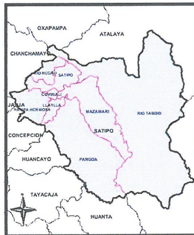
PROVINCIA DE SATIPO