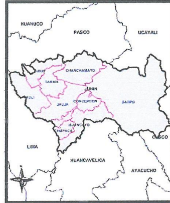
DEPARTAMENTO DE JUNIN