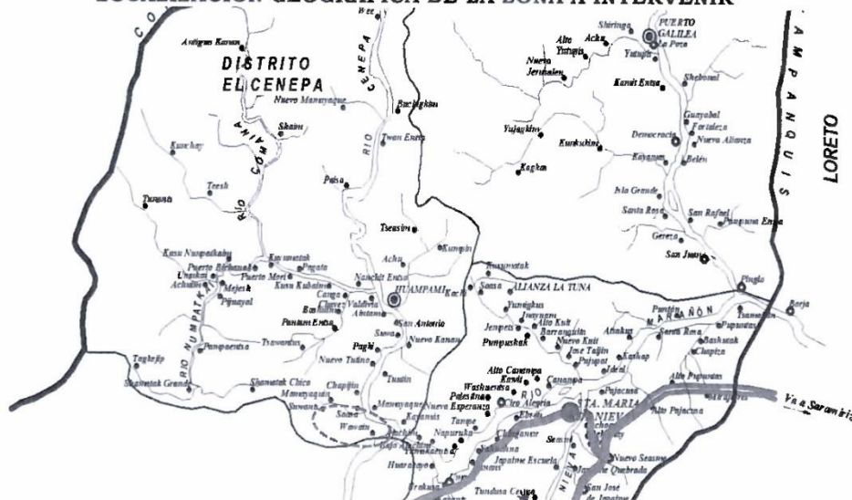
GRAFICO N° 02 LOCALIZACIÓN GEOGRÁFICA DE LA ZONA A INTERVENIR