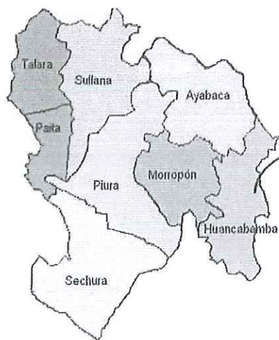
GRAFICO N°02: UBICACION POLITICA DE LA PROVINCIA DE HUANCABAMBA