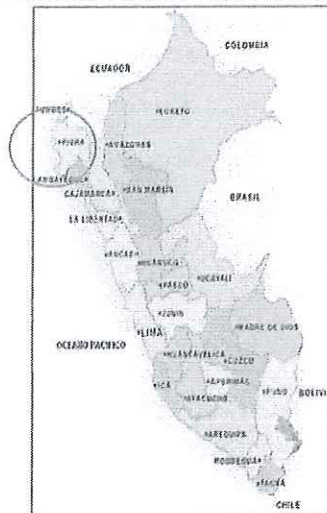
GRAFICO N° 01 UBICACION POLITICA DE LA REGION PIURA