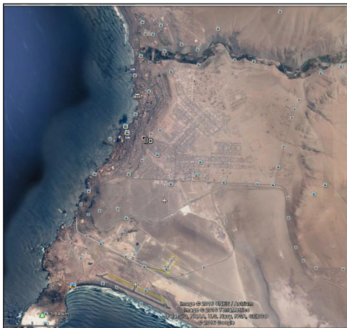
GRAFICO N° 2