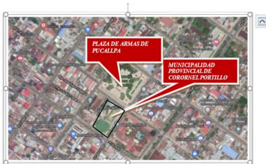
Ubicación: De la Municipalidad Provincial de Coronel Portillo