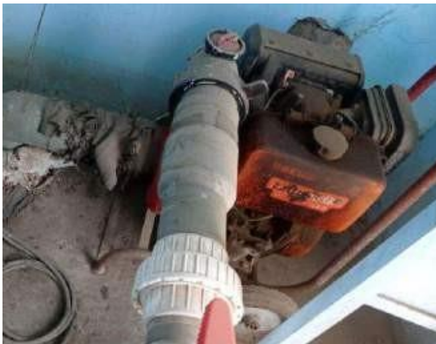
Motobomba de 2 HP en mal estado.