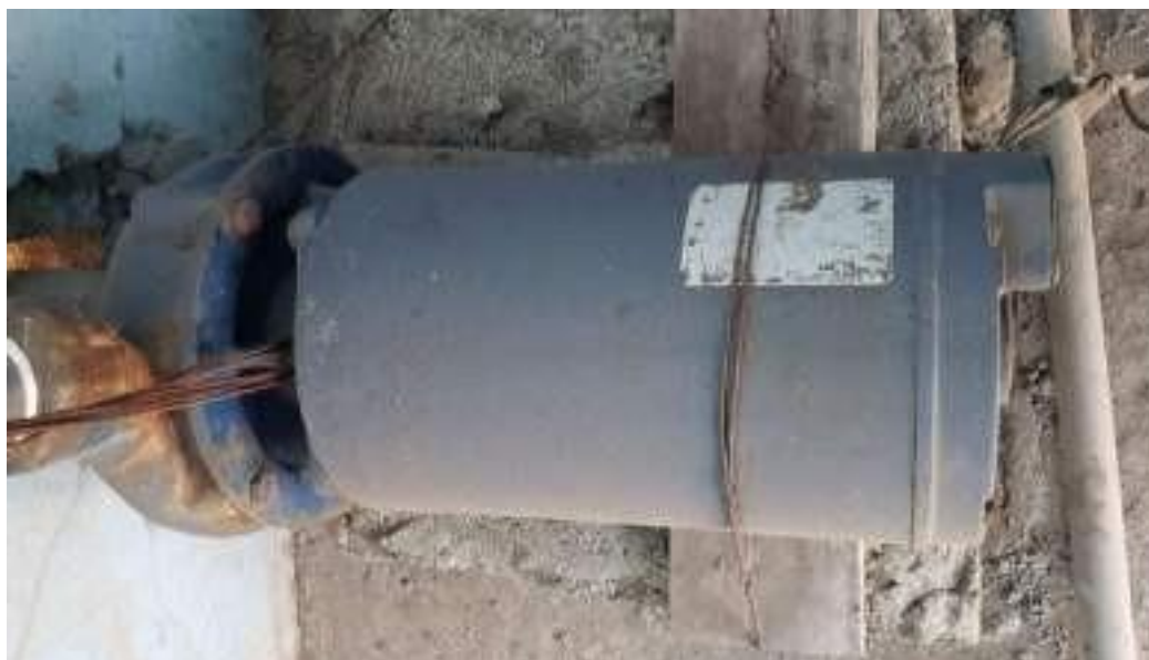
Electrobomba en mal estado