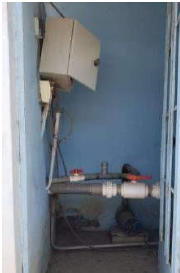
Instalación Electro bomba válvulas de compuerta PVC en caseta de bombeo