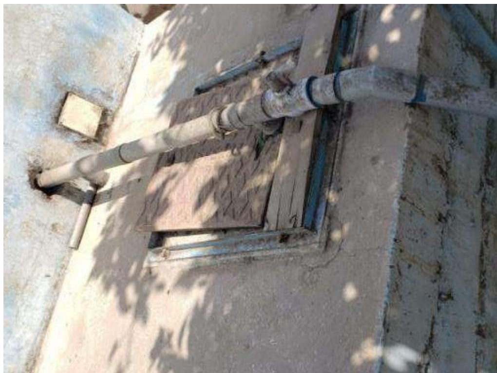
Pozo 02 de Captación de la localidad el Niño instalaciones en mal estado