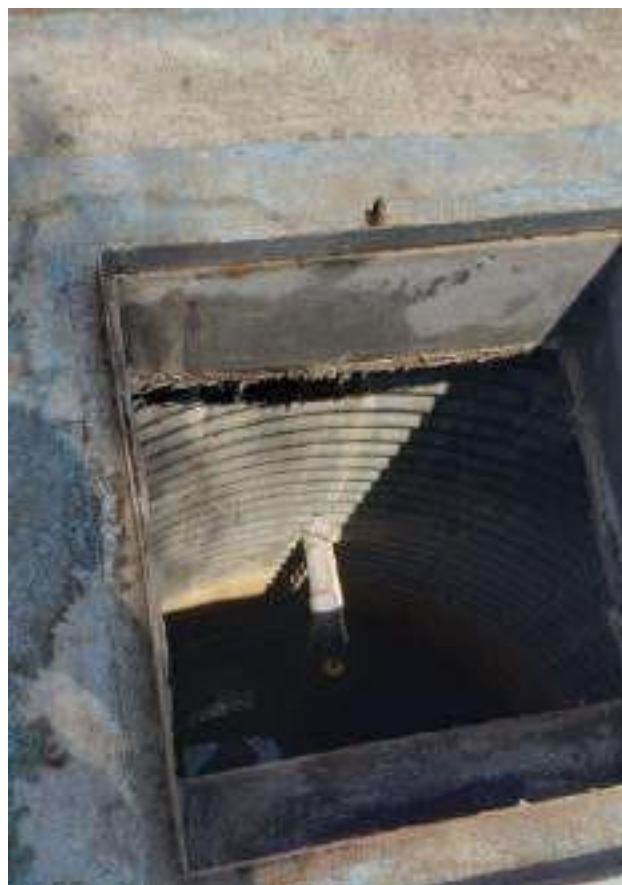
Pozo de Captación 01 con anillos de protección.