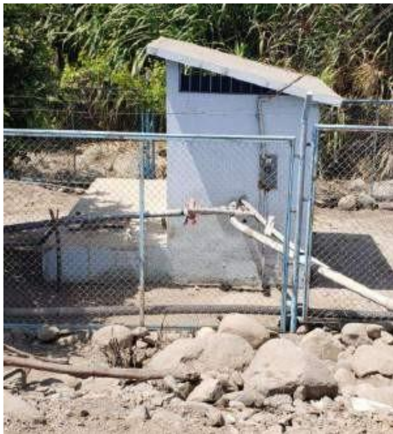
Pozo 02 de Captación y caseta de bombeo localidad el niño instalaciones en mal estado