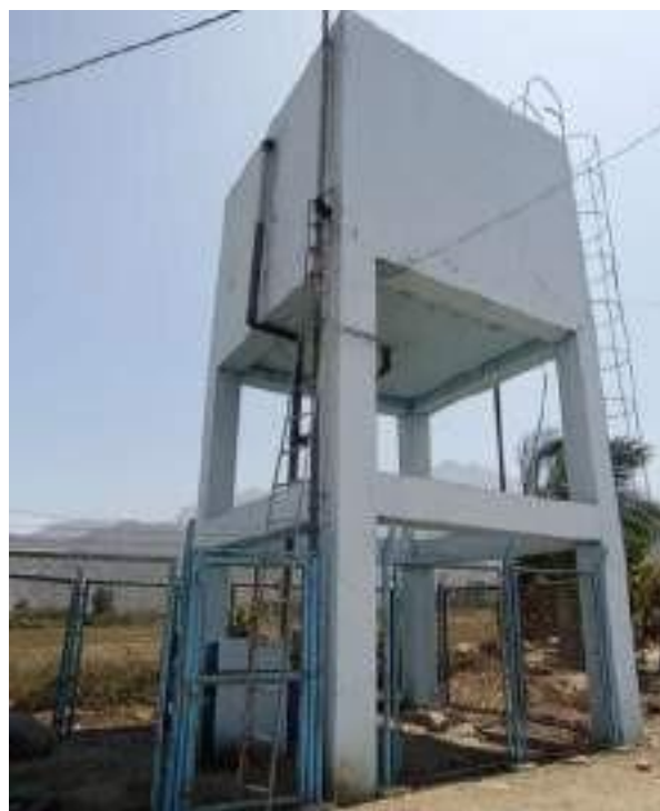
Tanque elevado – El Niño