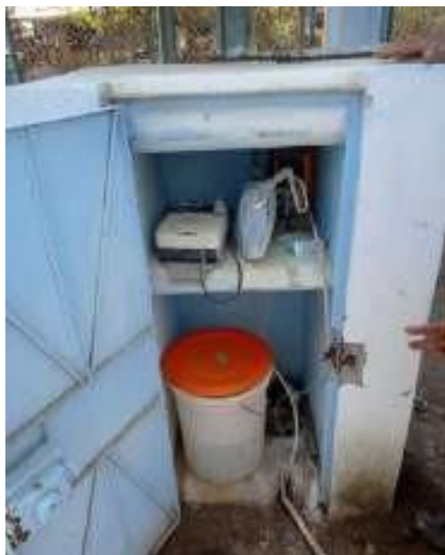
Sistema de Cloración construido de material precario, presenta deficientes