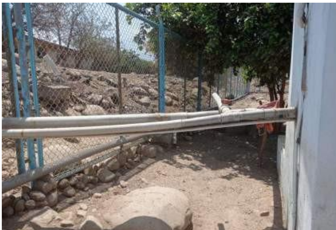
Línea de Impulsión tubería PVC 2" desde el pozo 02 hasta el Reservorio, cerco perimétrico presenta oxido.