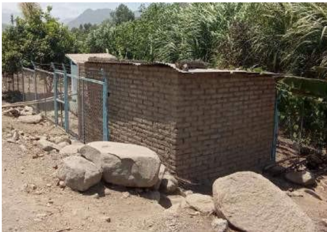
Almacén de Material Rustico