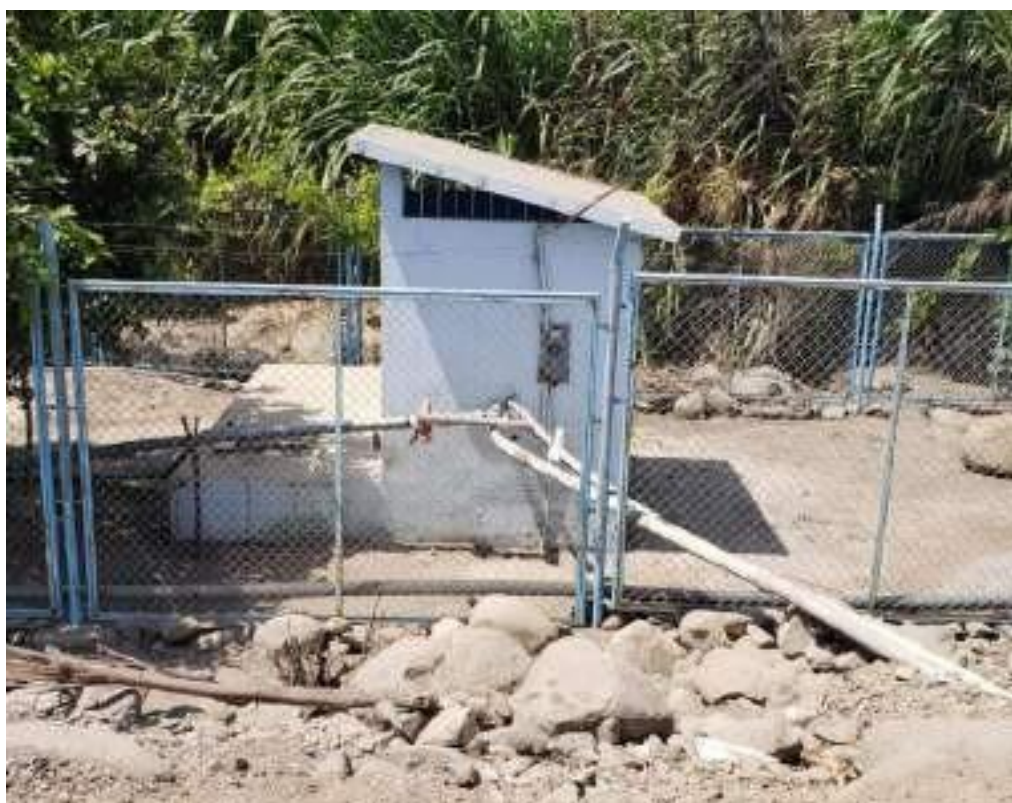
Salida de 2 Tuberías PVC de 2" instalaciones inadecuadas y en mal estado.