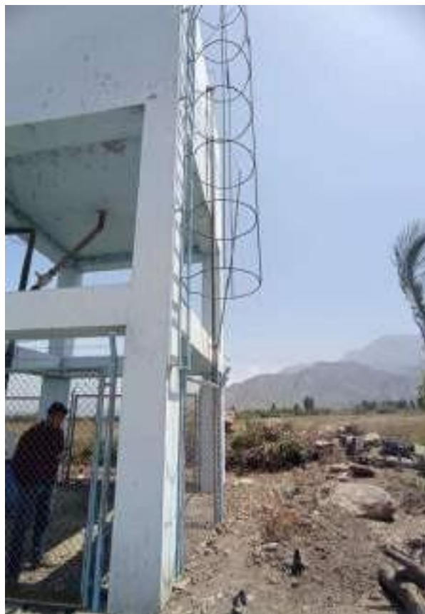
Tapa del tanque y Conexiones de la tubería se encuentran en mal estado