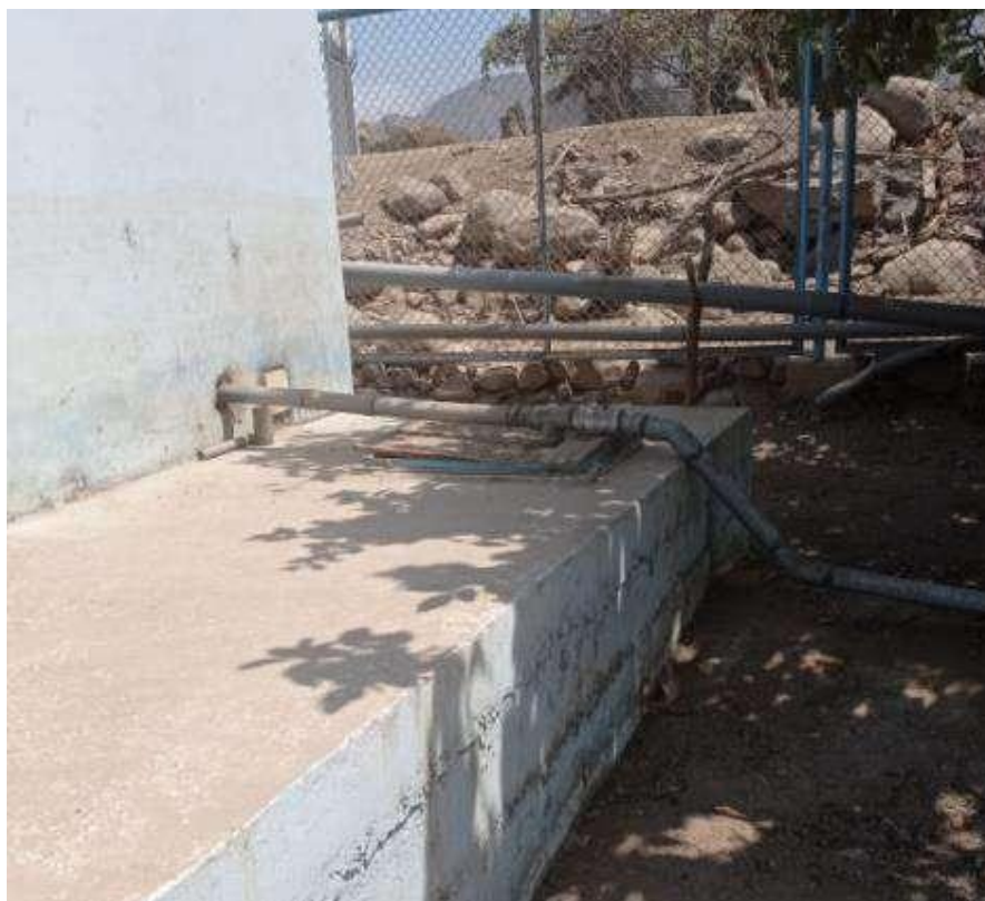
Línea de Impulsión tubería PVC 2" desde el pozo 01 hasta la bomba