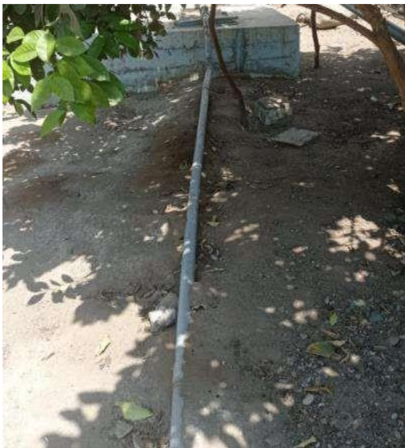
Línea de Impulsión tubería PVC 2" desde el pozo 01 la cual se encuentra en mal estado