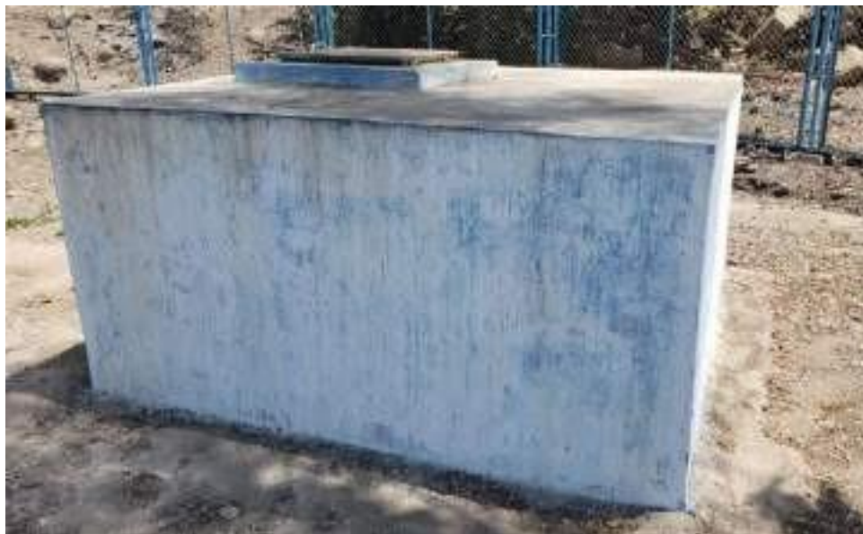
Estructura de protección para el pozo de captación 01