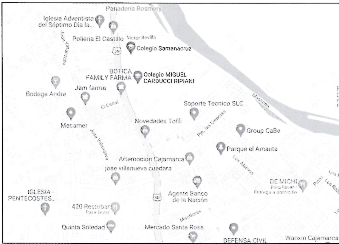
Figura 2: Ubicación de la Institución educativa