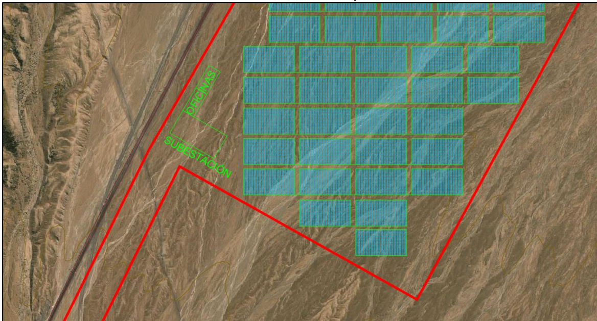
Figura N° 4 Subestación Eléctrica Pampa Gallinazos

La Línea de Transmisión 220 kV serviría de enlace entre la S.E. Pampa Gallinazos y la S.E. Interconexión, con la finalidad de evacuar la potencia y energía generada por la futura CSF Pampa Gallinazos hacia el SEIN. En ese aspecto, la línea de transmisión tendría las siguientes características: