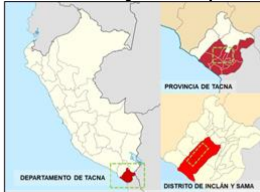
FIGURA N° 1 UBICACIÓN Geográfica del Proyecto

Con el cambio de localización de la Central Solar Fotovoltaica, y teniendo como referencia el diseño preliminar propuesto en el estudio a Nivel de Perfil; según las observaciones realizadas durante la visita de campo a la nueva zona del proyecto y las imágenes satelitales, se propone un diseño de instalación preliminar, el cual guarda relación con el distribución o diseño inicial, esto con el fin de maximizar la capacidad instalada y mantener costos razonables para la Central Solar Fotovoltaica: