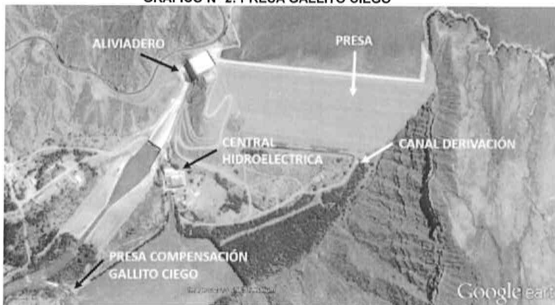
GRÁFICO N° 2: PRESA GALLITO CIEGO

Firmado digitalmente por HUAMAN PISCOYA José Francisco FAU 20520711865 soft Motivo: Doy V° B° Fecha: 2021/09/23 12:23:26-0500