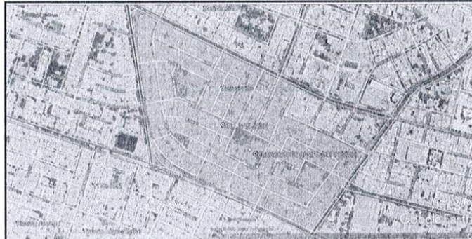
AREA DE INFLUENCIA EN EL URB. POPULAR SAN JOSE

"Año del Fortalecimiento de la Soberanía Nacional" "Decenio de Igualdad de Oportunidades para Mujeres y Hombres"