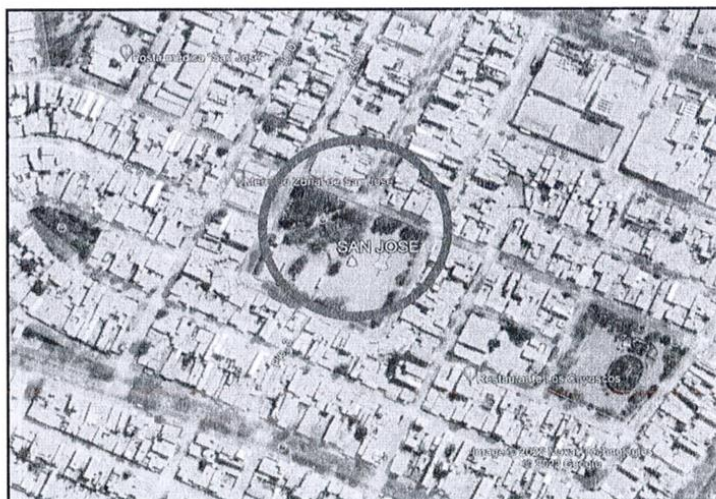
URB. POPULAR SAN JOSE

Con registrado en la SUNARP con Partida Registral N° 11116154.