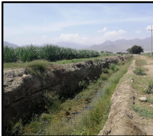
NUEVO CHIMBOTE, OCTUBRE DEL 2022

PARA LA CONTRATACIÓN PARA LA EJECUCIÓN DE LA ACTIVIDAD: “LIMPIEZA Y DESCOLMATACION DEL DREN LACRAMARCA, DISTRITO DE CHIMBOTE, PROVINCIA DE SANTA, DEPARTAMENTO DE ANCASH”