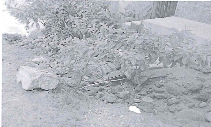
EN LA IMAGEN SE OBSERVA LA TUBERIA DE LA RED DE AGUA POTBALE EXPUESTA EN LA CUADRA 06 DEL JR. FEDERICO SÁNCHEZ.

funcionalidad de servicio a toda el área de influencia. Como se puede observar en las siguientes imágenes, tuberías expuestas que en el planteamiento del proyecto serán profundizadas: