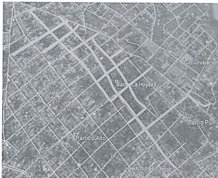
Ilustración 1. Localización del proyecto.

NOMBRE : EMAPA San Martín – Área de Distribución, Mantenimiento y Recolección De Redes