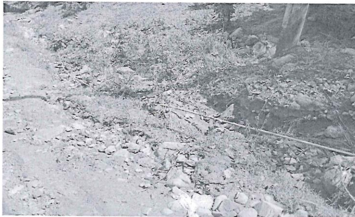
EN LA IMAGEN SE OBSERVA LA TUBERIA DE LA RED DE AGUA POTBALE EXPUESTA EN LA CUADRA 06 DEL JR. FEDERICO SÁNCHEZ.