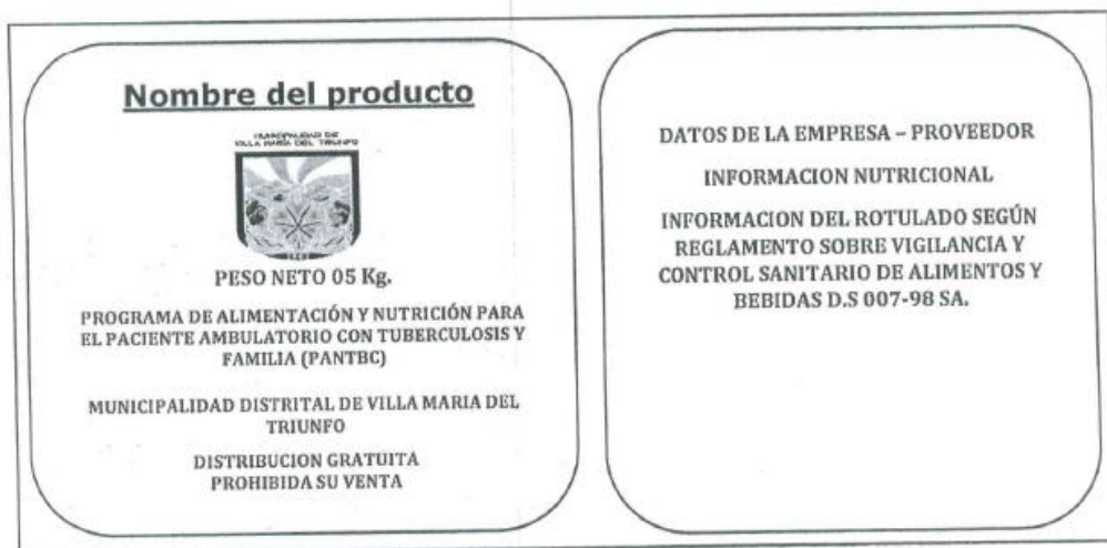
Imagen 1: Rotulado

En la entrega de los productos se exigirá que los mismos presenten sus rotulados conforme a los rotulados de la Imagen N° 01.